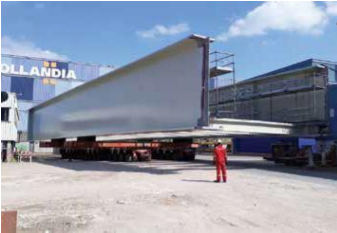
Aanbrug sectie 5 rijdt conserveerhal uit.