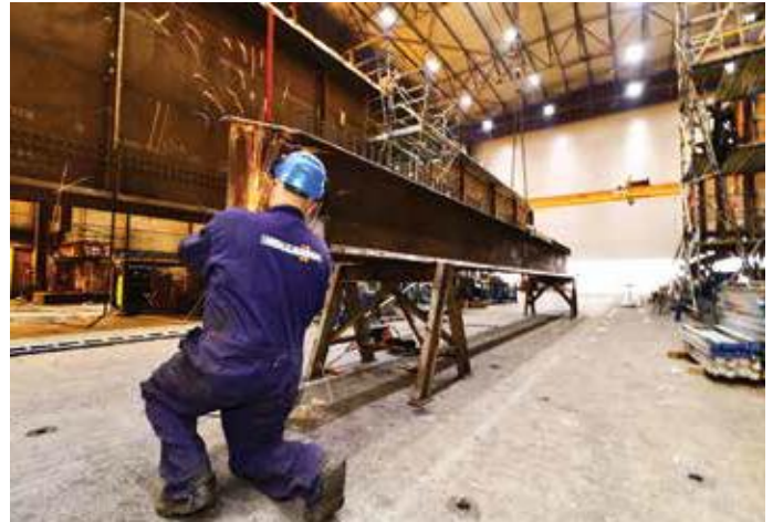
Voorbereiden dwarsdrager voor inbouwen in brugdek.

Infra en Iemants. Het contract betreft een Engineering & Construct-opdracht voor de bouw van een verhoogd spoorviaduct en de twee stalen boogbruggen (één boven de Rozenburgsesluis en één boven de Thomassentunnel). De werkzaamheden zijn in 2018 gestart en naar verwachting eind 2020 klaar.