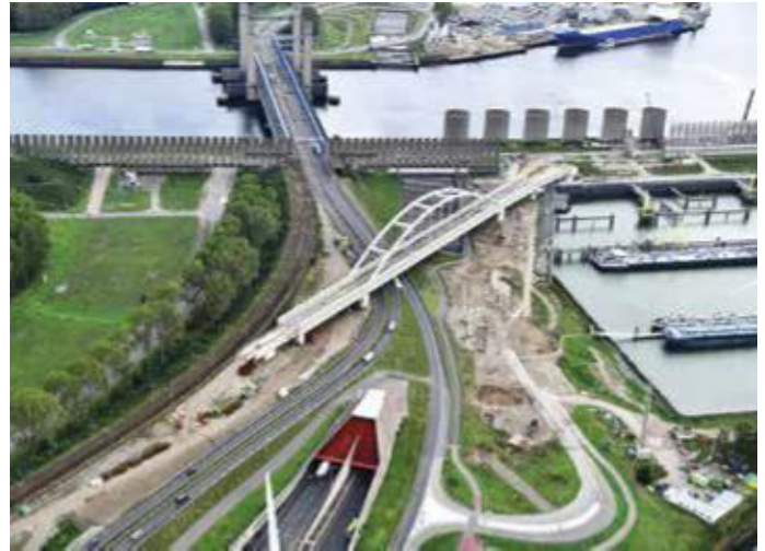
Brug op eindpositie boven de Thomassentunnel.