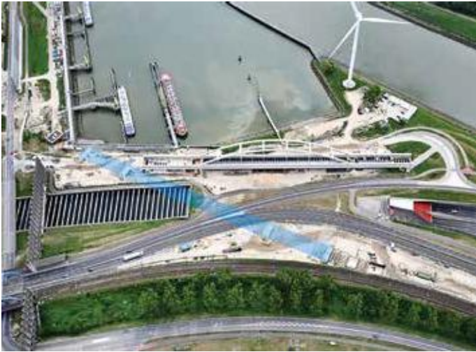
Brug op voorbouwlocatie en in (licht)blauw de uiteindelijke positie.

Opdracht Port of Rotterdam • Architectuur Maarten Struijs, Utrecht • Constructief ontwerp Movares, Utrecht • Uitvoering SaVe (Besix, Dura Vermeer, Mobilis, Hollandia Infra en Iemants) • Staalconstructie Hollandia Infra, Krimpen a/d IJssel • Transport Mammoet, Schiedam • Kosten € 20 miljoen (Spoorbrug Thomassentunnel) • Fotografie Guus Olierook, Danny Cornelissen PortPictures