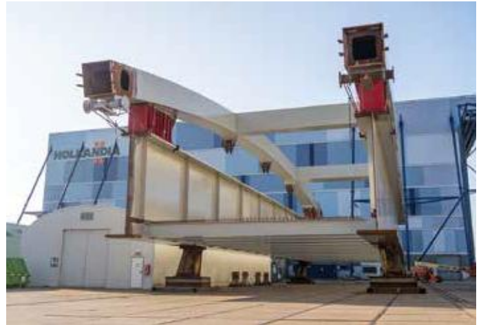
Sectie 3 met boogdeel gereed voor transport naar voorbouwlocatie.