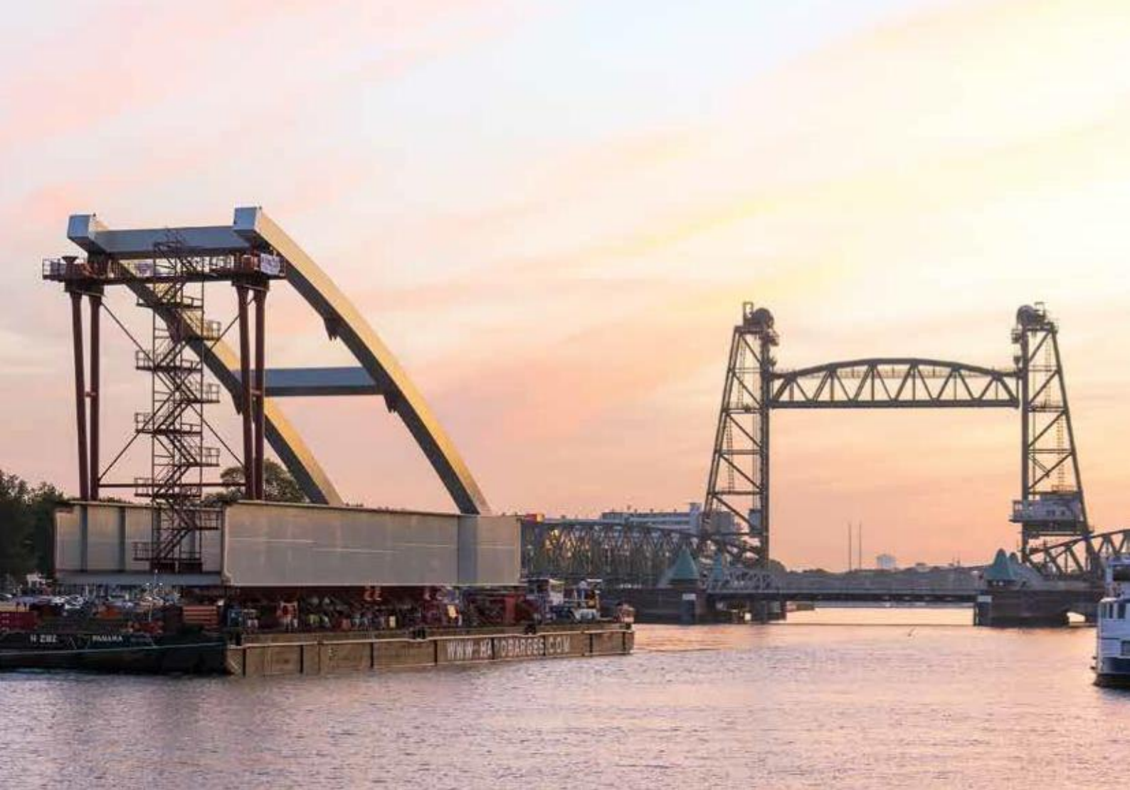
Transport brugdek met boogdeel vanuit Krimpen aan den IJssel door Rotterdam naar Rozenburg.

Na het sluiten van de boog werden de hangers gemonteerd. Dit werd gedaan vanaf de booggeboorten naar het midden van de boog, om zo de hangers op lengte in te kunnen brengen.