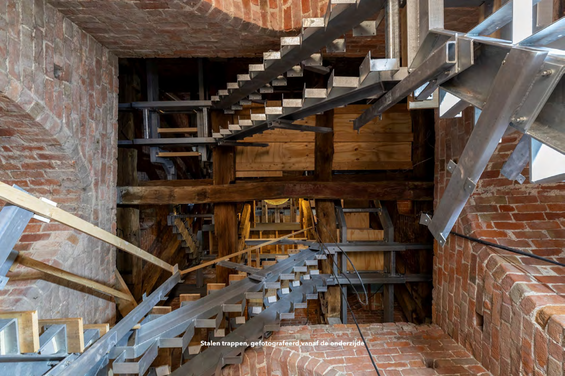
Stalen trappen, gefotografeerd vanaf de onderzijde