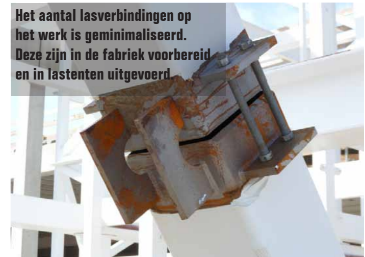
Het aantal lasverbindingen op het werk is geminimaliseerd. Deze zijn in de fabriek voorbereid en in lasten uitgevoerd.