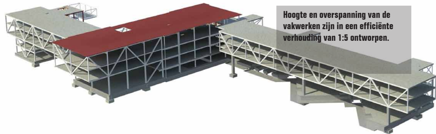
Hoogte en overspanning van de vakwerken zijn in een efficiënte verhouding van 1:5 ontworpen.