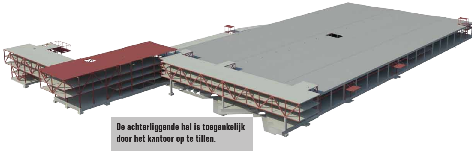
De achterliggende hal is toegankelijk door het kantoor op te tillen.